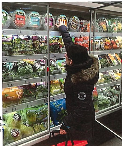
Capítulo 1, tado goza mpuesto s